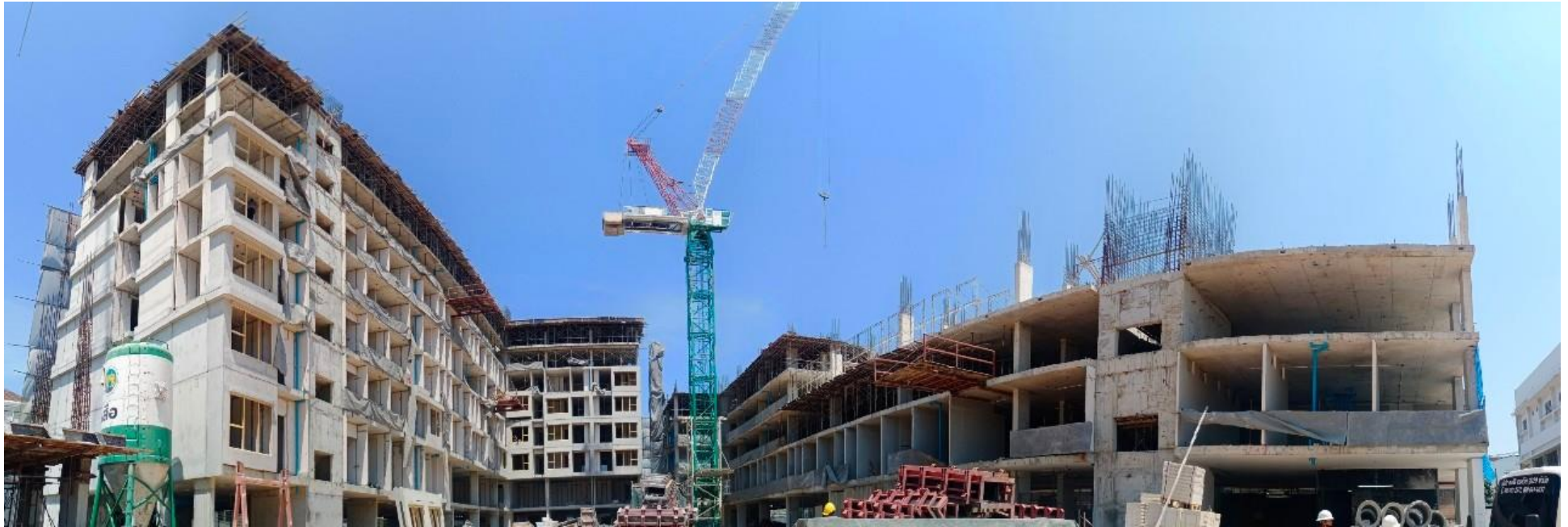
รูปที่ 1.3 สภาพโครงการในปัจจุบัน