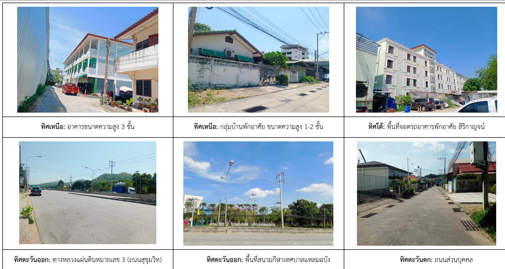
รูปที่ 1.2 แสดงการใช้ประโยชน์บริเวณพื้นที่โครงการและพื้นที่ใกล้เคียง